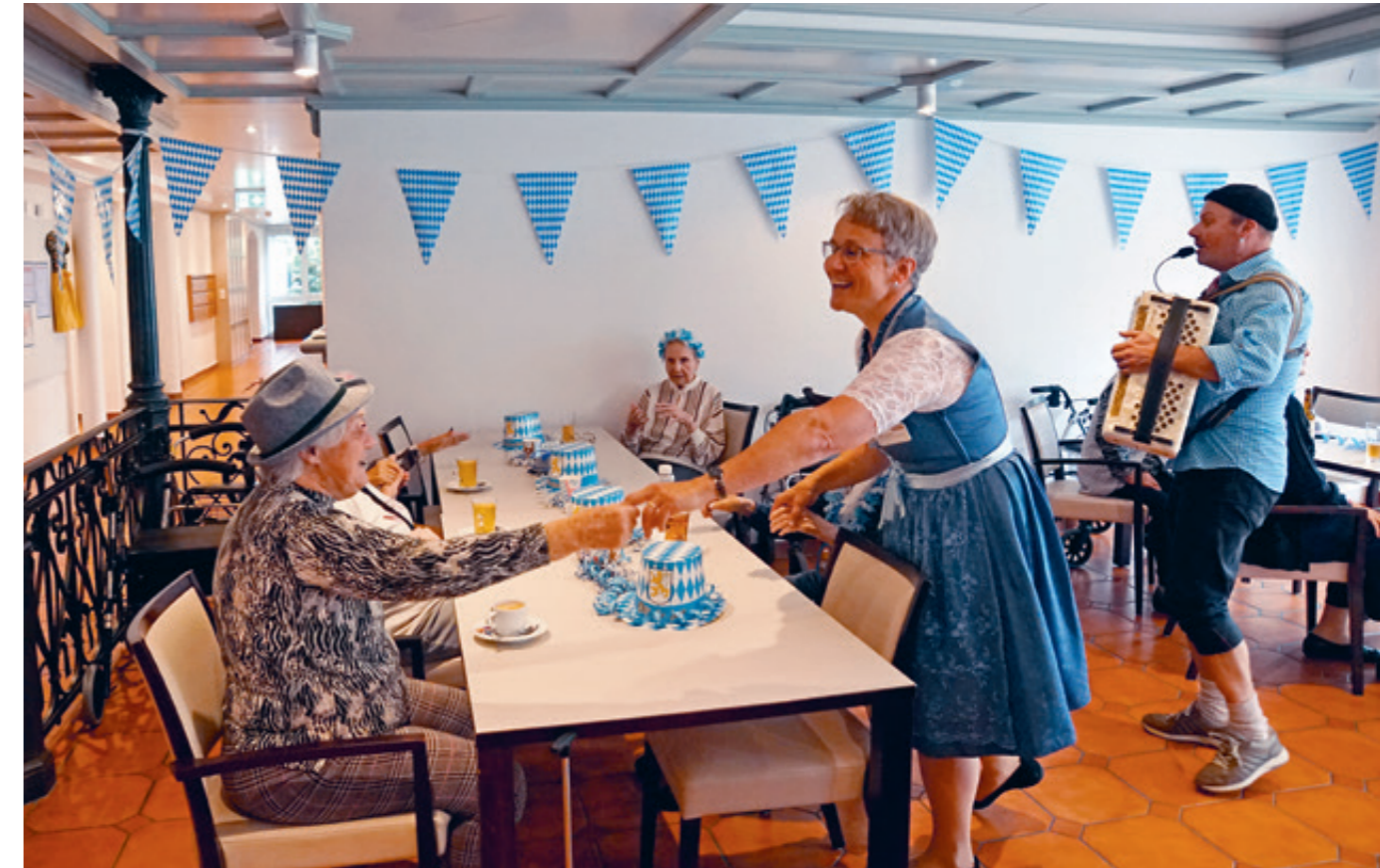
Oktoberfest 2024 im temporären Pflegeheim Rosenau, Kirchberg.