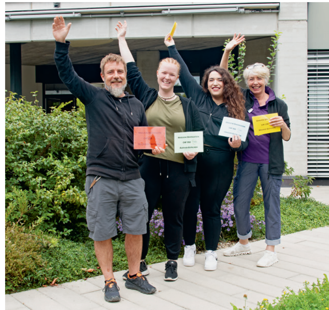
Die erste Zwischenverlosung von «WERTgewinn» brachte im August 2024 diese vier Mitarbeitenden zum Strahlen.

Thurvita setzt auf moderne Arbeitszeitmodelle, die 2024 nach einer erfolgreichen Pilotphase, wo sinnvoll, eingeführt wurden. Mitarbeitende können ihre Arbeitszeit nach individuellen Bedürfnissen gestalten und ihre Work-Life-Balance verbessern. Zudem profitieren die Mitarbeitenden von verschiedenen Benefits und monatlichen Sonderaktionen. Weiter konnten Mitarbeitende einander für das quartalsweise WERTgewinn-System nominieren – für Arbeitsleistungen, welche die Werte von Thurvita besonders gut spiegeln. Zwischenverlosungen entschieden über jeweils vier Mitarbeitende, welche einen besonderen WERTgewinn erhielten. Zum Abschluss der Aktion erfolgte eine Jahresverlosung mit grossem Hauptpreis.