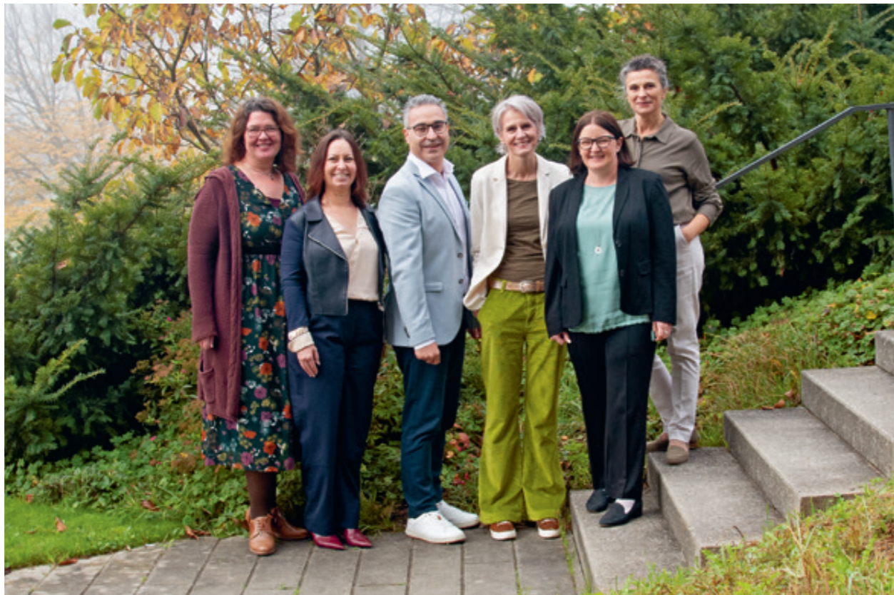
Die Geschäftsleitung führt die Thurvita mit ihrem breiten Fachwissen und persönlichem Herzblut.