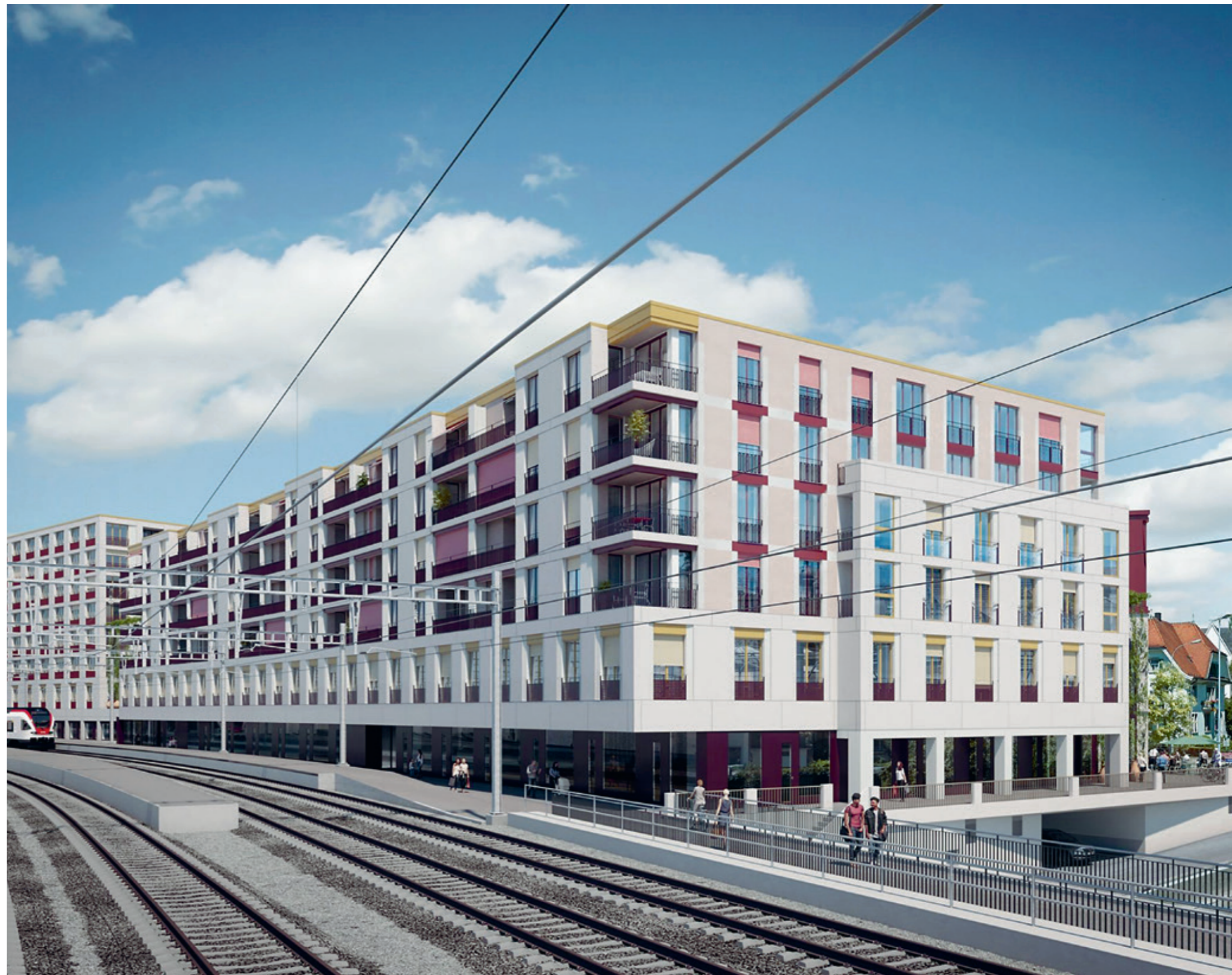
Die Überbauung «Perronimo» am Bahnhof Wil mit dem Thurvita «Quartierzentrum City» im östlichen Teil. Der Bezug ist für Frühling 2026 vorgesehen.

Die Alterswohnungen stossen auf ein grosses Interesse in der Bevölkerung. Die Vergabe wird anhand definierter Kriterien erfolgen, so dass für jede Person mit Unterstützungsbedarf das passende Angebot innerhalb der Thurvita gefunden werden kann.