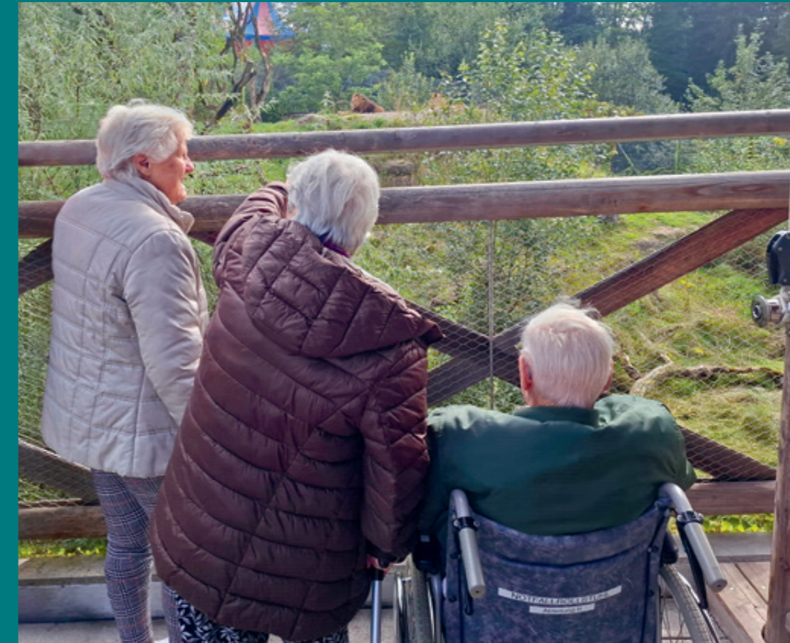
Spenden und Legate zugunsten von Thurvita ermöglichen besondere Aktivitäten, die sonst nicht finanzierbar wären – zum Beispiel der Besuch des Walter Zoos, wofür aufgrund der vielen Rollstühle ein Car zum Einsatz kommt.

In den nächsten Jahren wird Thurvita weiter an diesen Kernelementen arbeiten und so die Versorgung aus einer Hand für ältere Menschen weiter voranbringen.