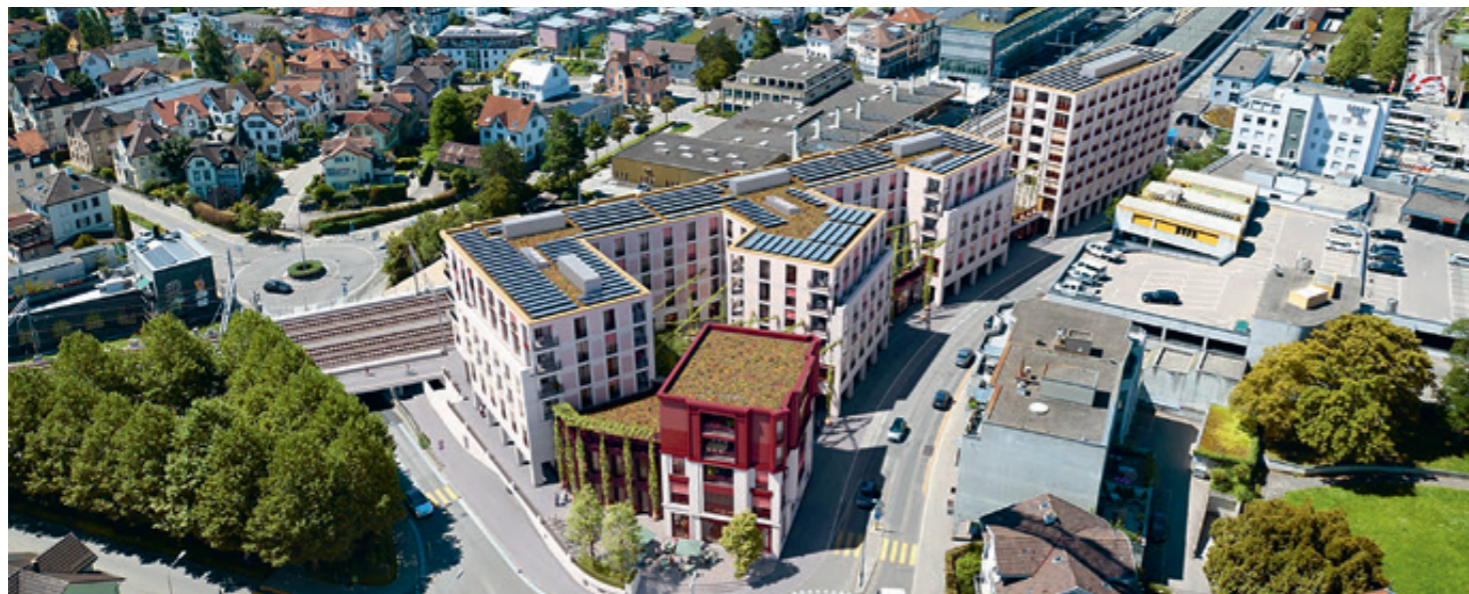
Das «Quartierzentrum City» und die Überbauung «Perronimo» aus der Vogelschau (Visualisierung).

Erfreulicherweise hat die St.Galler Stimmbewölkerung im November 2024 klar «Ja» zur Finanzierung der spezialisierten Langzeitpflege gesagt. Darin ist die Finanzierung der Pflege von Menschen mit Demenz zwar noch nicht abgebildet. Das Gesundheitsdepartement des Kantons St.Gallen hat aber den Auftrag, eine gesetzliche Regelung für die Förderung und Finanzierung der spezialisierten Demenzbetreuung zu prüfen. Es ist dringend notwendig, dass auf diesem Weg eine Grundlage für eine bessere Finanzierung der spezialisierten Langzeitpflege für Menschen mit Demenz entsteht.