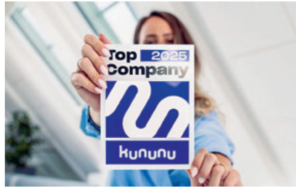
Thurvita ist «Top Company 2025».

Thurvita wird auch in den sozialen Medien positiv wahrgenommen. Thurvita ist beste Arbeitgeberin des Gesundheitsbereichs 2025 auf Kununu und erhält eine Bewertung von 4,4 von 5 Punkten sowie eine Weiterempfehlungsrate von 80%, was Thurvita als attraktive Arbeitgeberin auszeichnet.